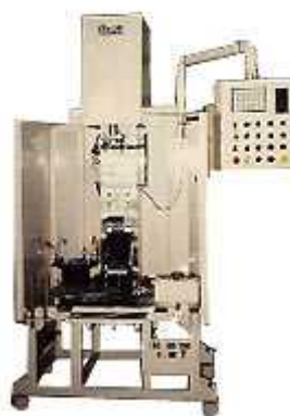
2TON 電動式スクリュープレス