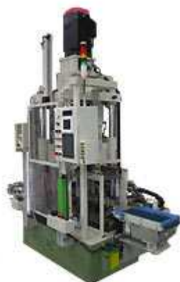
20TON 電動式スクリュープレス